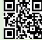
KU-MAホームページ QRコード