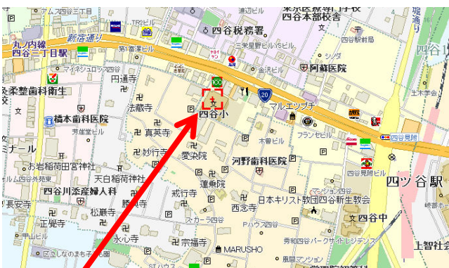
【会場】新宿区立四谷小学校 体育館