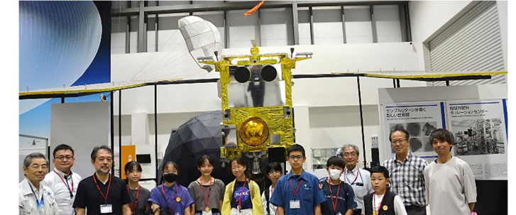
▲小惑星 2001CC21 命名キャンペーン選定委員の子どもたち