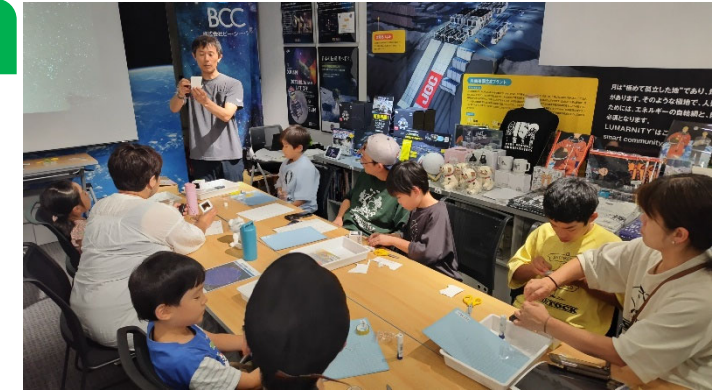
▲宇宙の教室 in 宇宙の店 ワークショップ 開催模様